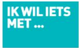
Hulp nodig? Vind de opleiding die bij je past!