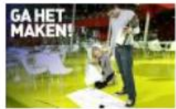
Bouw & Interieur College