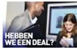
Business & Administration College