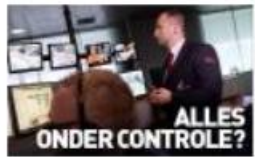
Veiligheid & Defensie College