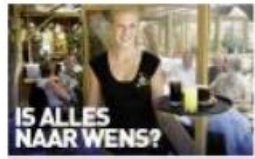
Horeca & Travel College